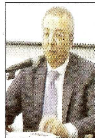
L'incontro nella Sala conferenze Ageforma

fronte al mondo accademico, sempre nella ferma volontà di offrire un ulteriore servizio alla nostra utenza, ma anche a quanti operano, in maniera professionale all'interno del mondo della formazio-